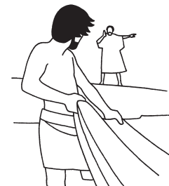
Nous avons trouvé le Messie....

DIMANCHE 22 janvier 2023 3ème dimanche ordinaire - ANNÉE A